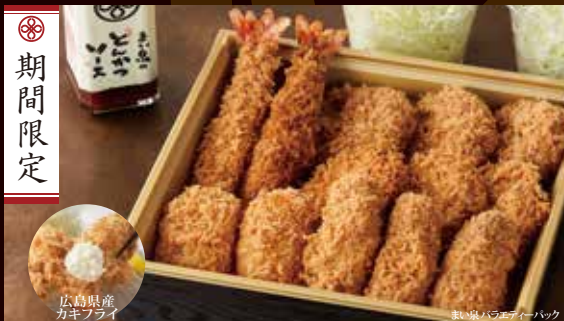
まい泉バラエティーパック <2~3人前> 5,000円(税込)

揚物: 広島県産カキフライ 3個、ヒレひとくちかつ 3個、黒豚メンチかつ 3個 エビフライ 2本、エビクリームコロッケ 2個 カップキャベツ 2個、まい泉のとんかつソース 1本