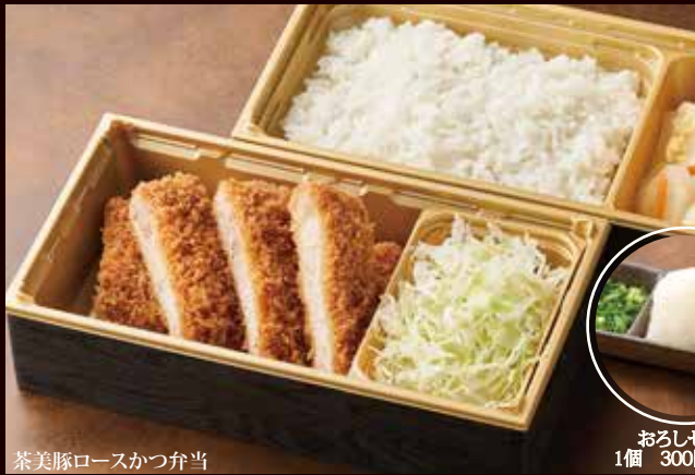
茶美豚ロースかつ弁当