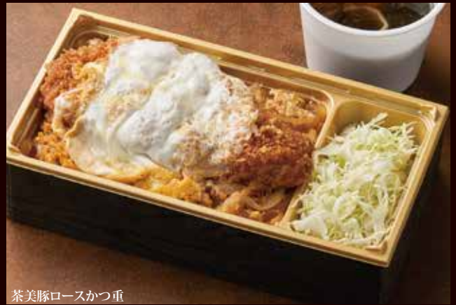
茶美豚ロースかつ重