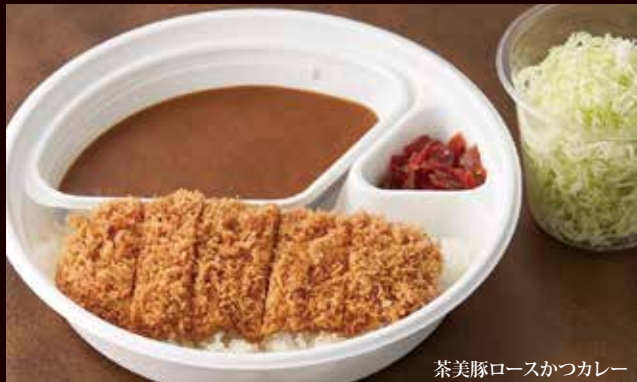
茶美豚ロースかつカレー