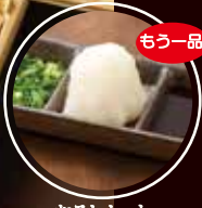
おろしセット 1個 300円(税込)