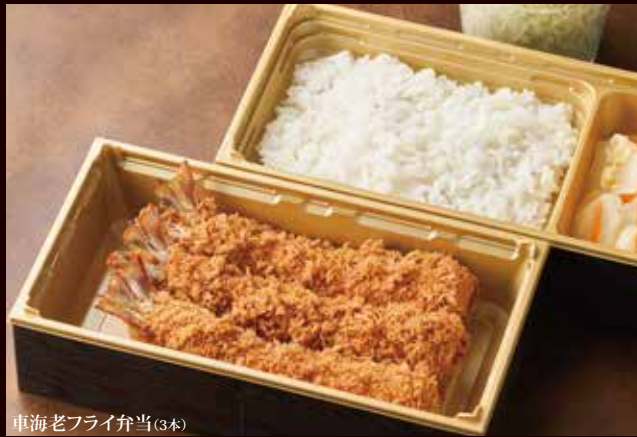
車海老フライ弁当 (3本)