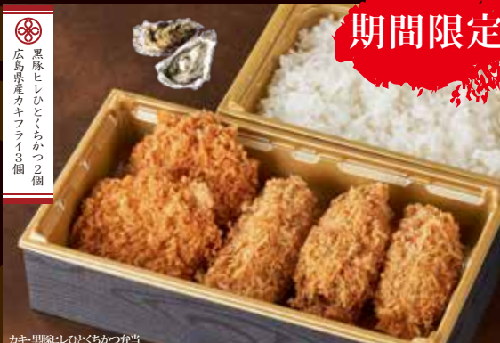
カキ・黒豚ヒレひとくちかつ弁当 <味噌汁付> 2,600円(税込)