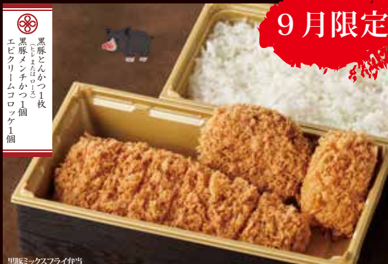
黒豚ミックスフライ弁当 <とん汁付> 3,000円(税込)