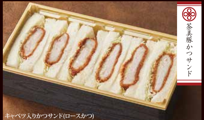
キャベツ入りかつサンド(ロースかつ)