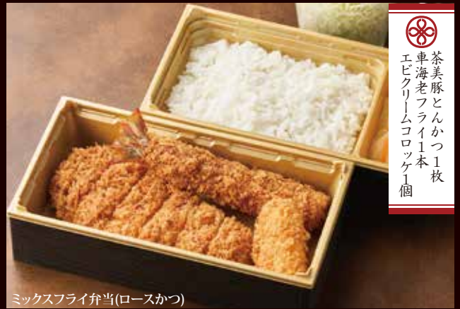
ミックスフライ弁当(ロースかつ)