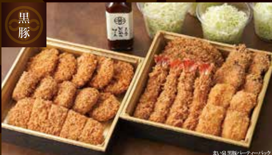
まい泉 黒豚パーティーパック <4~5人前> 6,400円(税込)

揚物: 広島県産カキフライ 3個、ヒレひとくちかつ 3個、黒豚メンチかつ 3個 エビフライ 2本、エビクリームコロッケ 2個 カップキャベツ 2個、まい泉のとんかつソース 1本